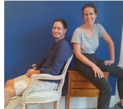
Revue de projets #1 : la Benne idée

https://www.laserre.org/actualites/revue-de-projets-1-la-benne-idee/